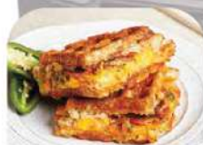
FARCIE AU BACON ET FROMAGE