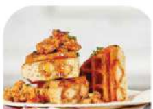
FARCIE AU POULET