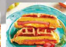
FARCIE AUX FRAMBOISES

Il est aussi possible de remplacer la pâte à gaufres par de la pâte à tarte ou de la pâte à cookies pour varier les plaisirs.