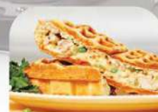
FARCIE AU POULET ET PETITS POIS